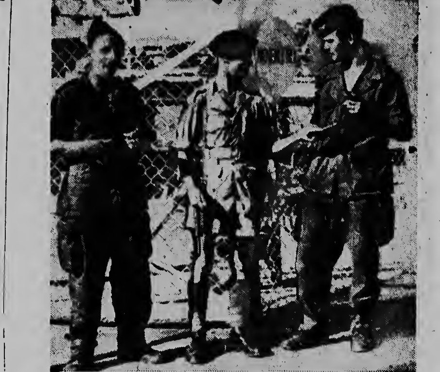
Na Cyprus regimentnan ta para cla pa drenta den accion na caso cu gobiernonan Frances y Ingles dicidi esei. Na Cyprus (un colonia Ingles) no solamente tin trupanan Ingles na tambe Frances (na derecho y izquierda) estaciona el temporalmente.